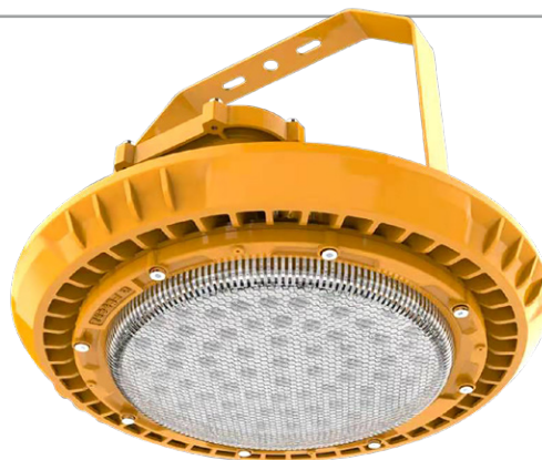
165W 200W y 240W

Tiene un Driver Electrónico Multivoltaje de 100-277V~, con un rango de voltaje de operación máximo de ±10%.